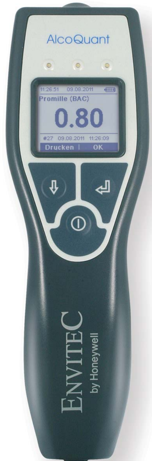
Gerät in Originalgröße